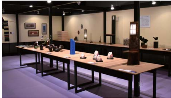
飛騨高山つくり手の会 2016