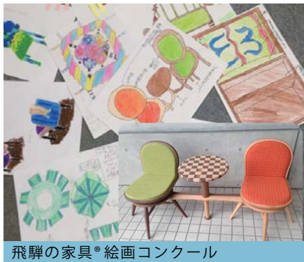
飛騨の家具® 絵画コンクール

岐阜印とはメイド・イン・岐阜を大切に、岐阜を元気にする素敵なモノづくり。そんな商品やそれに関わる企業を、たくさんの人に知って頂く為の活動です。木製品だけではなく様々な岐阜の優れたモノづくりに触れられる展示です。