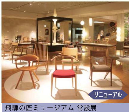
飛騨の匠ミュージアム 常設展