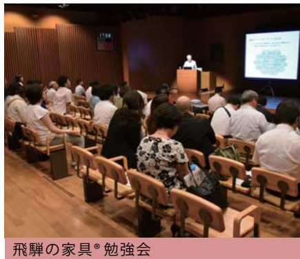
飛騨の家具® 勉強会