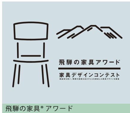
飛騨の家具® アワード