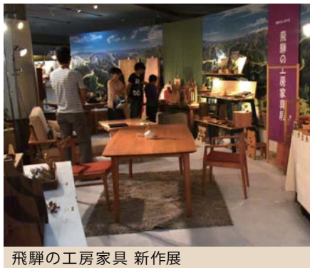
飛騨の工房家具 新作展